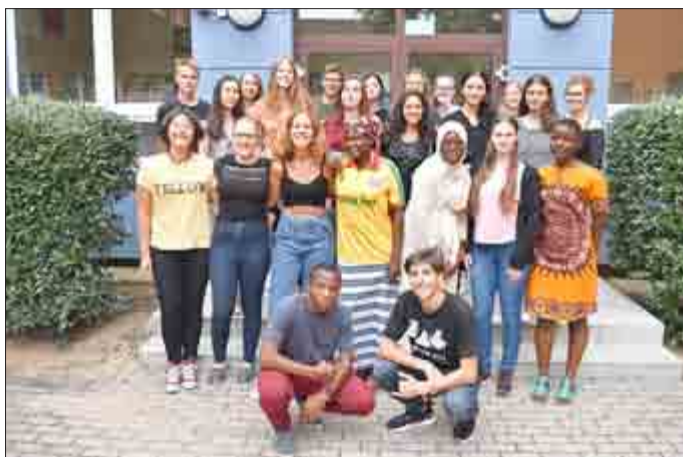
Die Schüler aus europäischen Nachbarländern, Asien und Afrika mit ihren Gastgebern aus dem Eichsfeld zum abschließenden Erinnerungsfoto.